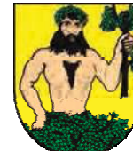
Město Město Albrechtice