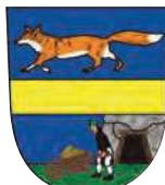
Město Vrbno pod Pradědem