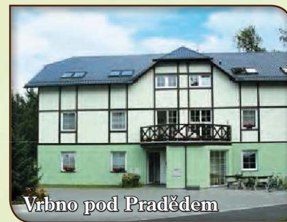
Vrbno pod Pradědem