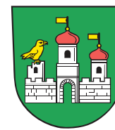
Obec Staré Město