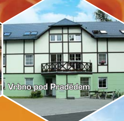
Vrbno pod Pradědem