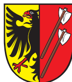
Město Horní Benešov