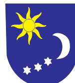
Obec Světlá Hora