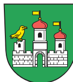
Obec Staré Město