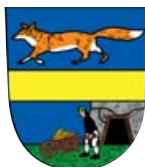
Město Vrbno pod Pradědem

V roce 2018 naši činnost částkou vyšší než 10.000,- Kč podpořili: