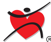
Nadace rozvoje zdraví