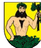
Město Město Albrechtice